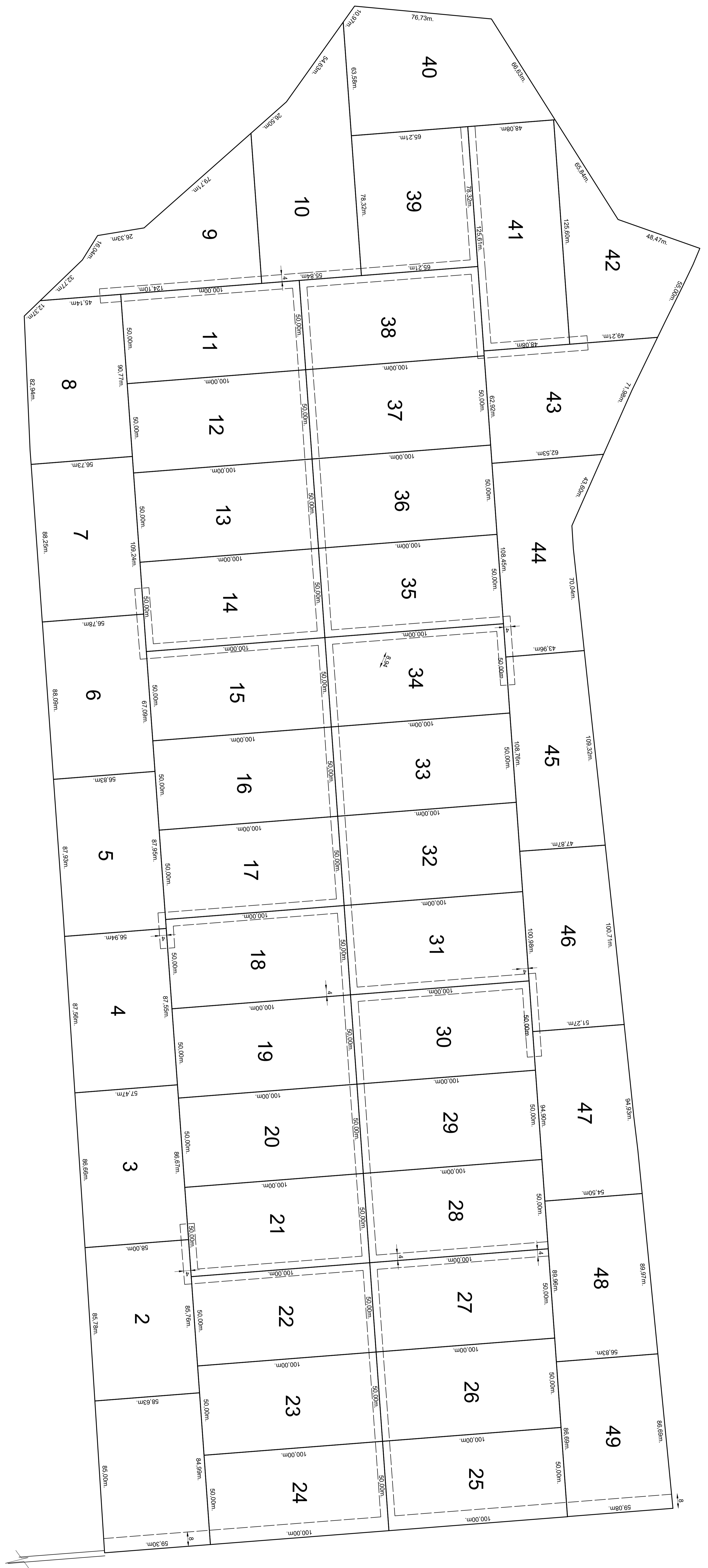
CUADRO DE SUPERFICIES SITUACIÓN PROPUESTA